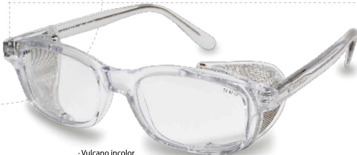
· Vulcano incolor