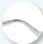
Hastes com alma metálica.