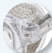
Dobradiças metálicas incorporadas.