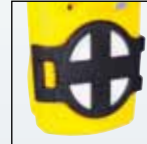
Kit de filtros auxiliar