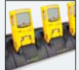
Carregador de cinco unidades

Para uma lista completa de acessórios, entre em contato com a BW Technologies by Honeywell.