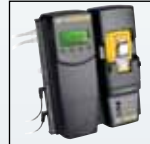
Compatível com MicroDock II