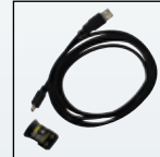
Kit de conectividade por infravermelho