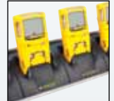
Carregador de cinco unidades

Para uma lista completa de acessórios, entre em contato com a BW Technologies by Honeywell.